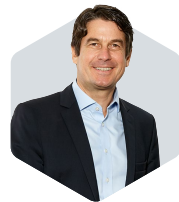
STEFAN BORGAS CEO

O novo logotipo da RHI Magnesita, formado a partir do símbolo do infinito e das formas dos nossos tijolos, representa a continuidade do nosso compromisso e serviço, a interconexão de nossa equipe e clientes em todo o mundo e a solidez de nossos produtos. Ao longo das próximas semanas e meses, aguardamos ansiosamente para apresentar a marca RHI Magnesita para nossos stakeholders. Cada um de vocês, da nossa equipe de 14.000 pessoas, é um embaixador da nossa marca e tem o papel de cumprir as promessas que ela traz.